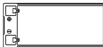
F2 (FASTON TAB 250)